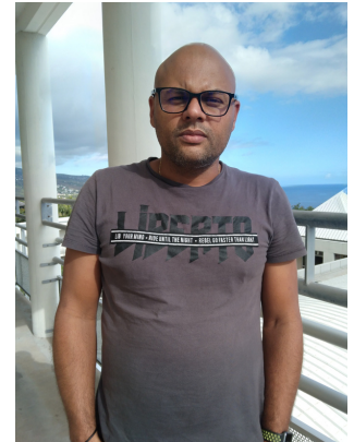
kozman in lamontrèr LVR

Félicitations aux nouveaux enseignants habilités qui s'inscrivent dans la continuité des parcours en langues vivantes préconisés dans le PSA.