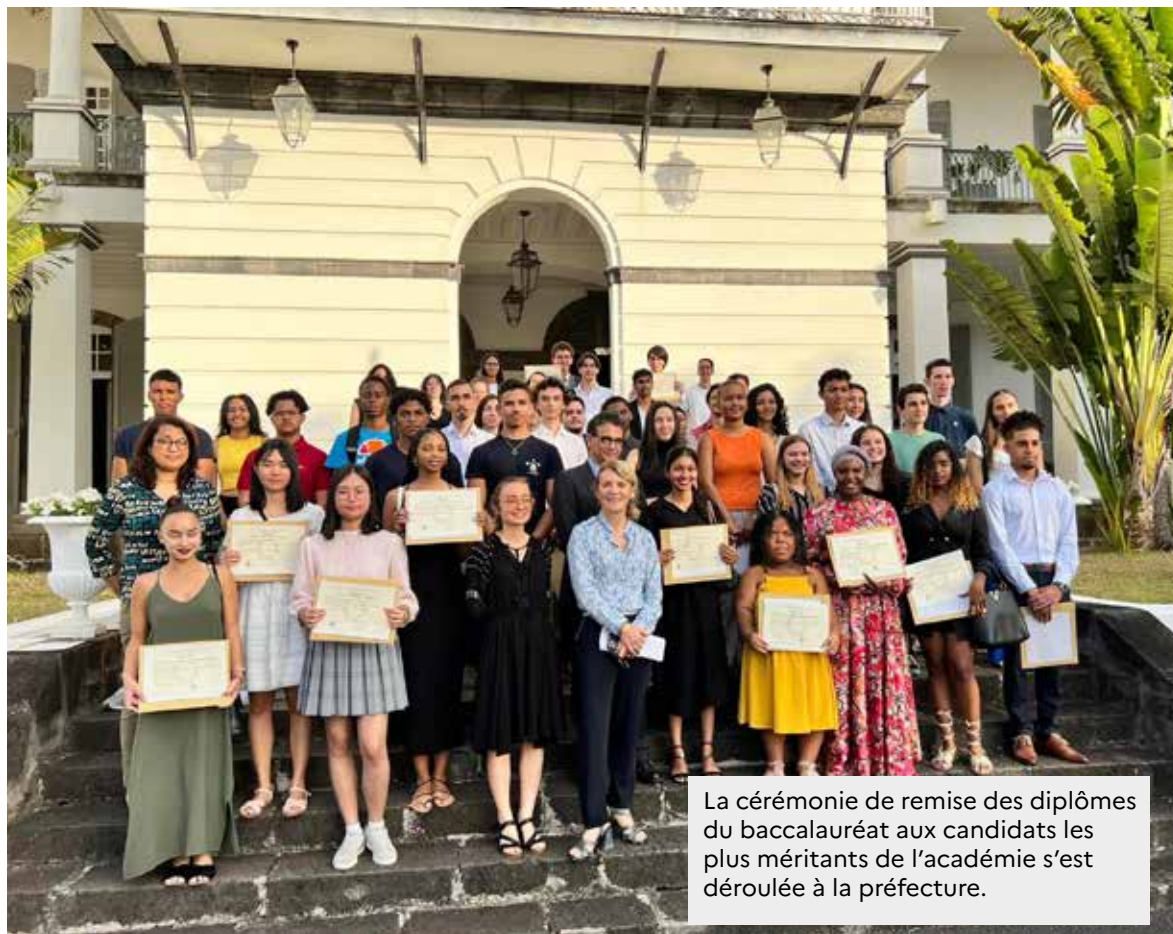
La cérémonie de remise des diplômes du baccalauréat aux candidats les plus méritants de l'académie s'est déroulée à la préfecture.

Les candidats conservent le bénéfice de leur classement dans Parcoursup jusqu'aux délibérations finales.