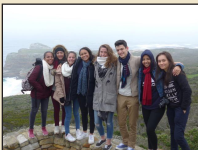
Lors du stage Afrique du Sud 2019