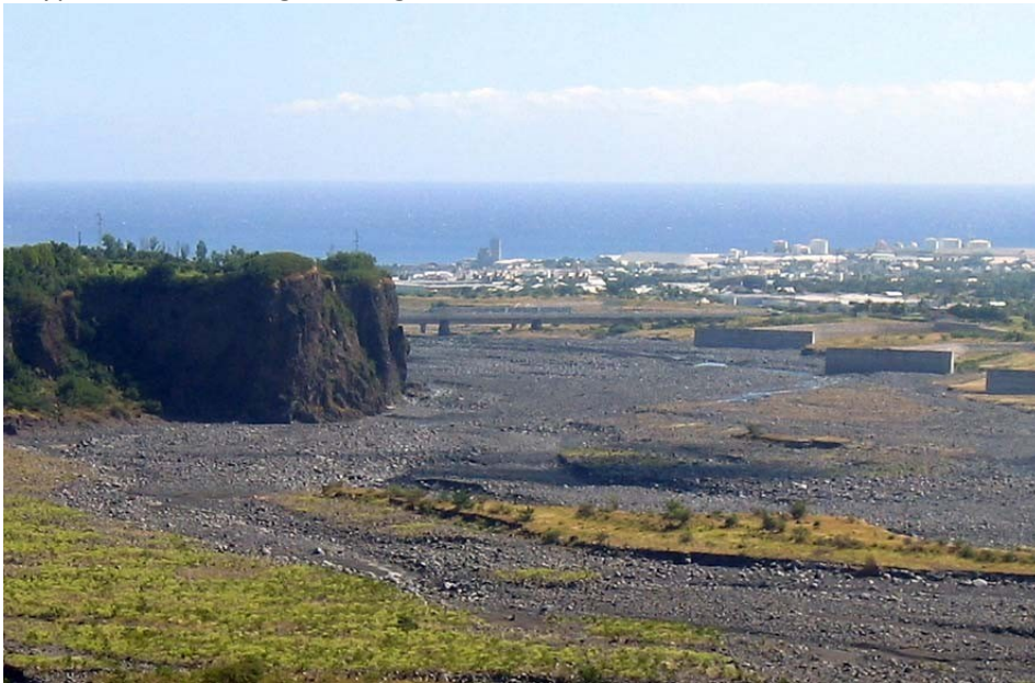
Photographie du paysage étudié

Formuler des hypothèses sur l'origine des galets des rivières.