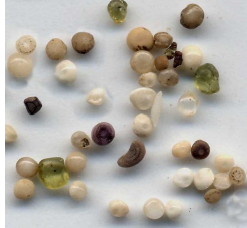
Photo montrant quelques particules du sable : foraminifères*, débris de coraux et piquants d'oursins, particules de basaltes.

Foraminifères* : Ce sont des êtres vivants de très petites tailles (le plus souvent microscopiques) qui vivent dans l'eau et construisent un test (=sorte de coquille). A la mort du foraminifère, son test peut se déposer au fond de la mer.