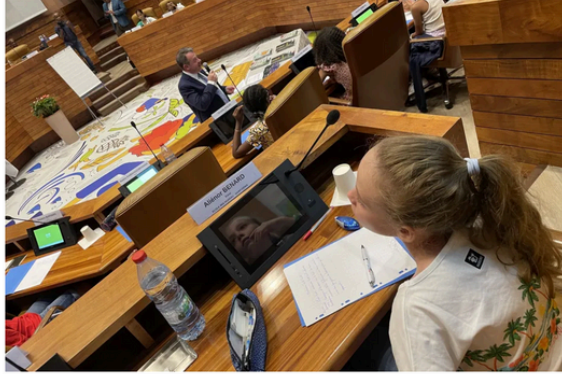
Finale de la dictée bilingue français/kréol à la Région • ©Elyas Akhoun |