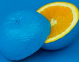
Image médiatique Abordée avec l'éducation aux médias et à l'information. Souvent associée à l'éducation morale et civique

Apprendre à lire, à décrypter l'information de l'image, à aiguïser une intelligence sensible et critique Pour devenir un média citoyen .